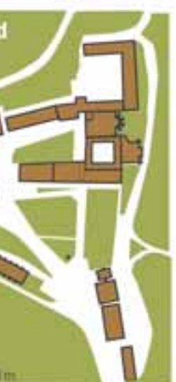
Gráfico: Alberto Erra. Textos: Jesús Rubio Fotografías: Gobierno de Navarra, Calleja Fuentes: Sitna, Google Street View, Catálogo Monumental de Navarra, Revista Panorama, número 27, www.roncesvalles.es y elaboración propia

Capilla del Espíritu Santo Es probablemente el edificio más antiguo del conjunto colegial, ya que la capilla original se pudo levantar en el siglo XIII. La tradición la identifica como el lugar donde Carlomagno mandó erigir un enterramiento para Roldán y los demás caballeros muertos en la batalla de Roncesvalles. Por eso se la conoce como Silo de Carlomagno. En todo caso, ha sido remodelada varias veces y, de hecho, a la capilla original la rodea un claustro herreriano del siglo XVII.