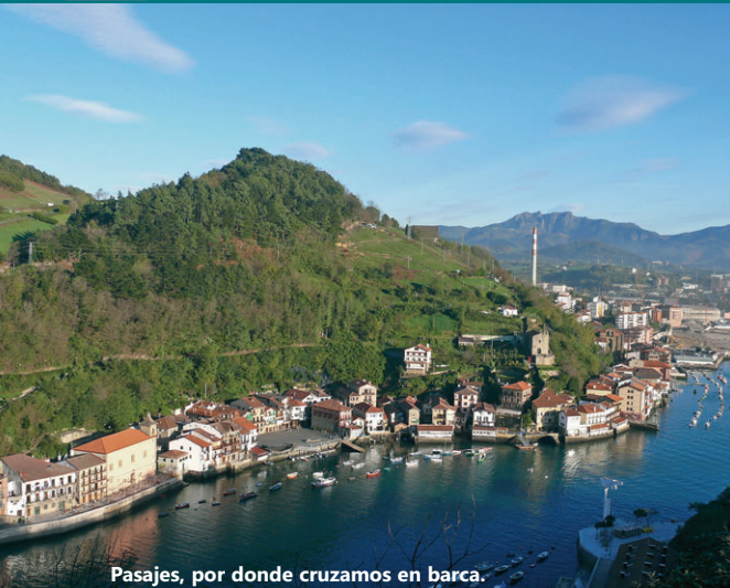
Pasajes, por donde cruzamos en barca.

Primera etapa de nuestra larga travesía. Iniciamos el Camino del Norte en la frontera franco-española y llegaremos a la primera capital de provincia, San Sebastián. Tras cruzar Pasajes, hay varias opciones, como se ve en el mapa. Dos montes y un paso en barca de una ría marcan la etapa. Buena señalización por caminos y senderos , principalmente. El